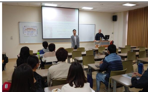
主持人介紹講者來歷