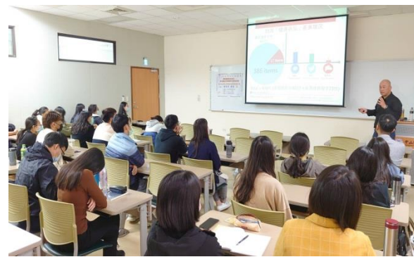
學生認真聆聽演講