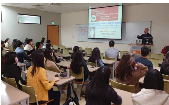
學生認真聆聽演講