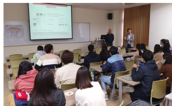
主持人、講者於演講尾聲與同學進行交流