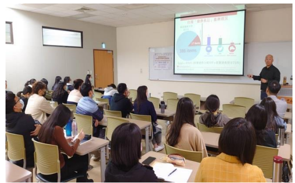
學生認真聆聽演講