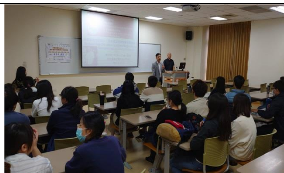
主持人開場歡迎演講者