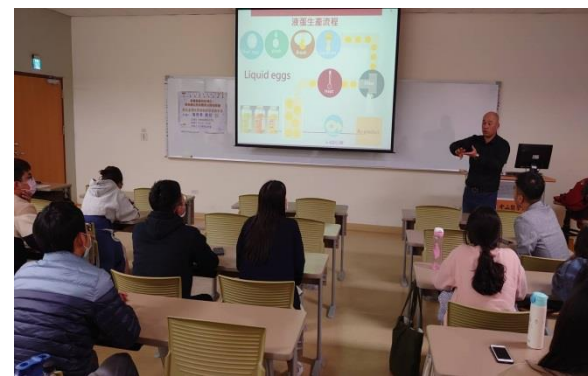
問與答-台下學生向講者提問