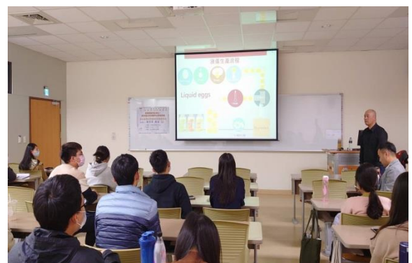
問與答-台下學生向講者提問