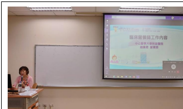
講者介紹自身來歷