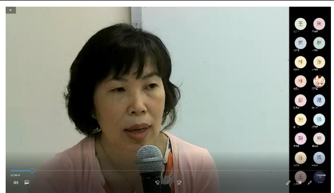
線上演講畫面截取