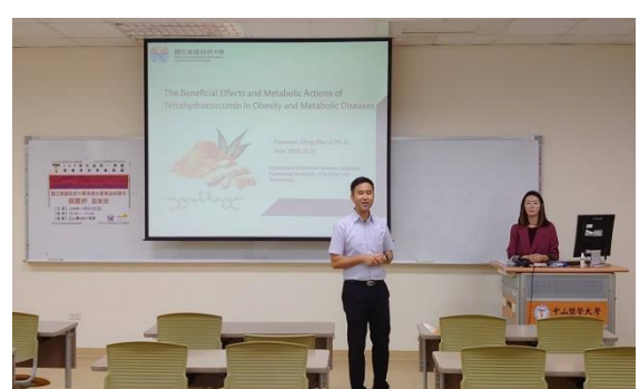
主持人介紹講者來歷