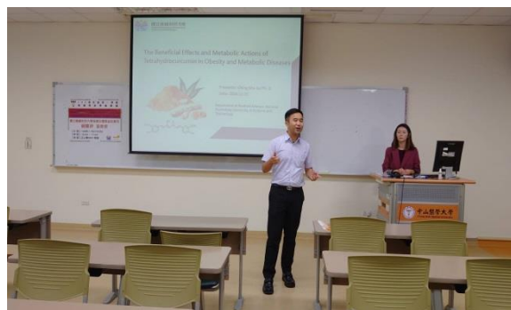
主持人開場歡迎演講者