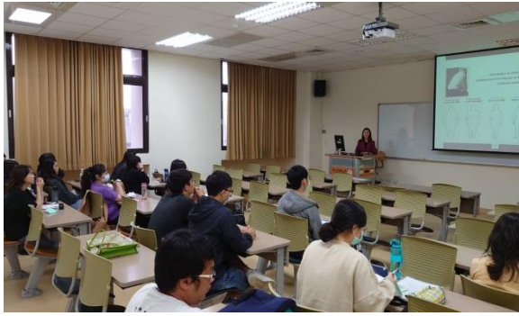
學生認真聆聽演講