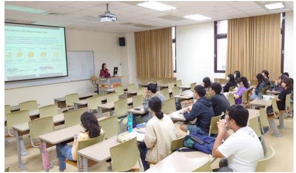
學生認真聆聽演講